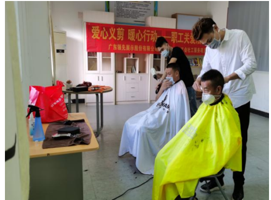
广东领先展示股份有限公司