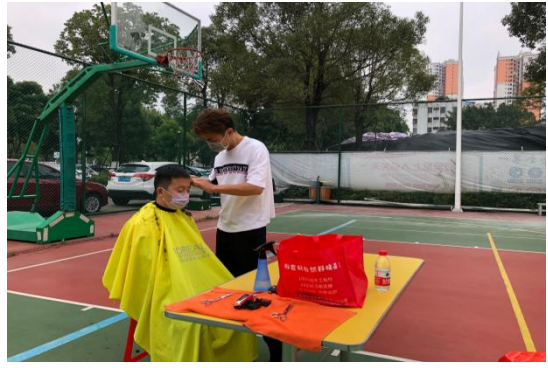
中国电信中山分公司